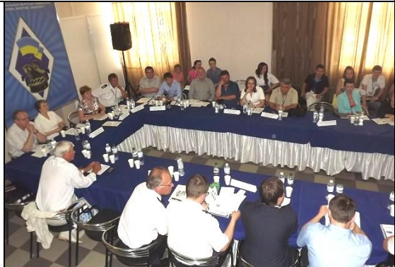
Круглый стол ОНМУ «Формула будущего специалиста: бизнес и образование в морской области»

Одесский национальный морской университет провел круглый стол: «Формула будущего специалиста: бизнес и образование в морской области», по итогам которого были выделены основные сферы сотрудничества образовательных и бизнес структур в вопросе подготовки специалистов для морской отрасли: подготовка специалистов и повышение квалификации работников предприятий отрасли и преподавательского состава профильных ВУЗов, поддержка бизнеса и образовательных структур на всех возможных уровнях, создание совместных проектов для эффективного сотрудничества образовательных и бизнес структур в процессе подготовки специалистов.