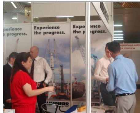
Активная работа на стенде Компании Liebherr

лов), Южмормонтаж, Транс-сервис-КТТ, Универсал Сервис Украина, Крановый завод «Кранкомплект». Впервые на экспозиции выставки компания СКТ ПОРТ представила мобильные судопогрузчики, производства компании SAMSON M-H Ltd. (UK). Свою деятельность на выставке представила Компания Денал Групп представители производителей кранового оборудования ведущих мировых производителей: PodemCrane AD (Болгария), Demag Cranes&Components (Германия), Schneider Electric (Франция).