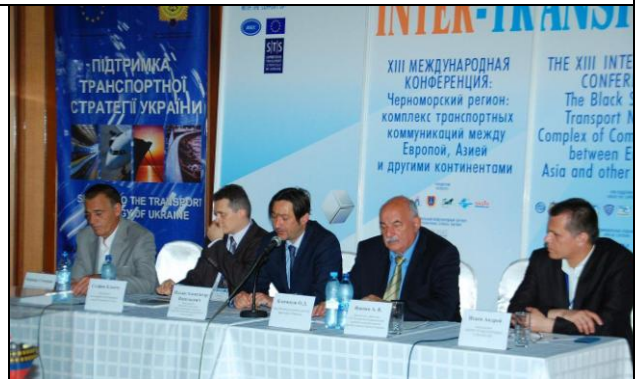
Пленарное заседание конференции «Транспортная сеть Черноморского региона: комплекс коммуникаций между Европой, Азией и другими континентами»