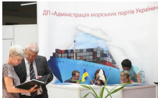
Экспозиция ГП «Администрация морских портов Украины»

Свои новейшие достижения в области подъемно-транспортного оборудования представили на стендах компании: Konecranes Украина, Liebherr-Werk Nenzing GmbH (Австрия), Kirow Ardelt (Германия), ЮЖТЕХСЕРВИС, МХМ Украина (официальный представитель NEUERO в СНГ и члена Украинской ассоциации вторичных метал-