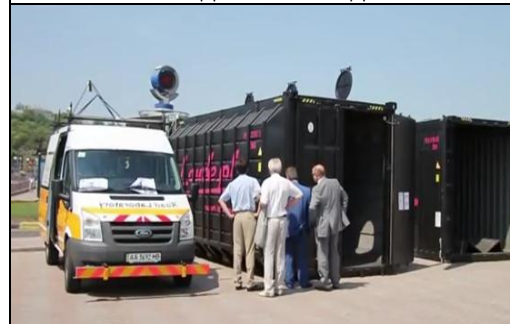
Контейнеры Компании Laude и автомобиль-лаборатория ГП «УКРГИПРОДОР» на наружной экспозиции выставки

Активным интересом среди участников и гостей выставки пользовался стенд ООО «Первая грузовая компания в Украине», оператора подвижного состава ОАО «Первая грузовая компания», крупнейшего в СНГ оператора грузовых вагонов. Компания ZEPPELIN POWER SYSTEMS GMB H & Co.KG представила свою деятельность в области модернизации локомотивов и дизель-поездов и в области постройки новых тепловозов на конференции.