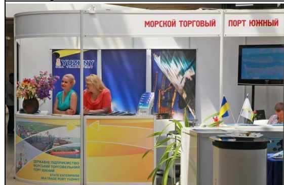
Экспозиция Морского торгового порта «Южный»

Свои новейшие достижения в области подъемно-транспортного оборудования представили на стендах компании: Konecranes Украина, Liebherr-Werk Nenzing GmbH (Австрия), Kirow Ardelt (Германия), ЮЖТЕХСЕРВИС, МХМ Украина (официальный представитель NEUERO в СНГ и члена Украинской ассоциации вторичных метал-