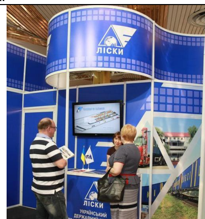
Индивидуальный стенд УГЦТС «ЛИСКИ»

Интерес посетителей вызвал индивидуальный стенд группы компаний OREXIM - динамично и успешно развивающейся компании по перевалке и хранению зерновых культур и сыпучих грузов.