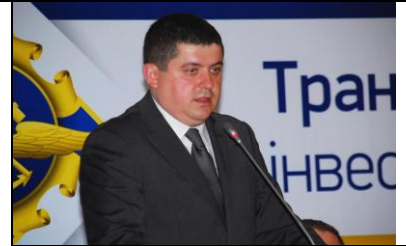
Министр инфраструктуры Украины Максим Бурбак на форуме «Транспорт: инвестиции в будущее»

Работу транспортной недели открыл форум «Транспорт: инвестиции в будущее». Министр инфраструктуры Украины Максим Бурбак, приветствуя участников, поблагодарил их за то, «что в это нелегкое для Украины время они нашли возможность приехать сюда, они нашли возможность быть тут, не обращая внимания на те вызовы, которые есть в обществе». Он также выразил уверенность в том, что «после завершения этой недели мы увидим некоторые новые проекты». «Со своей стороны, и со стороны Министерства, и правительства Украины мы сделаем все для того, чтобы они были защищены, чтобы инвестиции в Украину все-таки были, и сделаем все возможное, чтобы вернуть Украине доверие бизнеса и власти», — сказал Максим Бурбак.